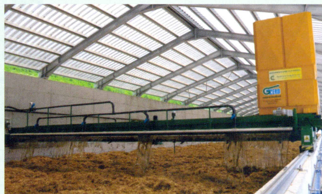
La fase di spandimento dei liquami sul letto di biomassa ligno-cellulosica