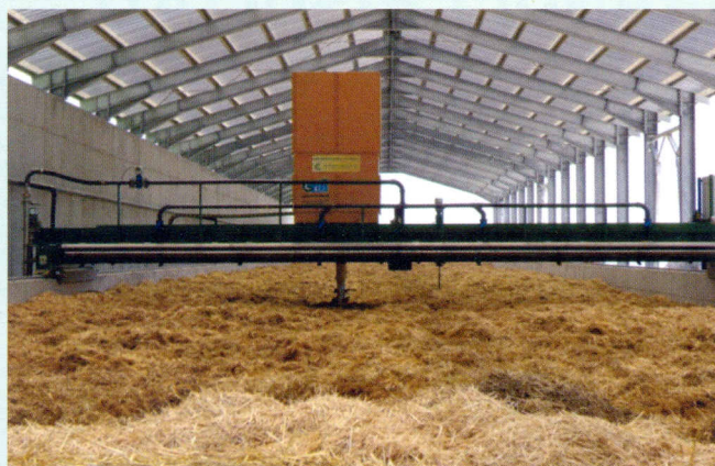
Il biodigestore C.I.f. modil

Nel campo la sostanza organica rappresenta l'unica forma di energia disponibile