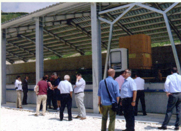
Un momento dell'inaugurazione di un nuovo impianto di trattamento di reflui suinicoli a Bosco Chiesanuova (VR)

Un altro aspetto molto interessante sono i limitati costi di trattamento che questo tipo di processo comporta; nel caso del sistema C.l.f. modil , data la quasi totale meccanizzazione e automazione delle operazioni, il fabbisogno di manodopera è limitato alla fase iniziale e finale del processo con un'incidenza sul costo complessivo piuttosto contenuta (i consumi elettrici sono contenuti in 10 Kwh limitatamente alla fase di lavorazione). Come ogni sistema innovativo il know-how deve crescere insieme alle tecnologie applicate; per questo motivo è nata G-zero, la società che commercializza il biodigestore C.l.f. modil e che garantisce, a costi molto contenuti, tutti i servizi pre e post-vendita. Lo staff tecnico-commerciale di G-zero, infatti, affianca l'allevatore in tutte le fasi della gestione del biodigestore: dal calcolo del modello più confacente alle caratteristiche e alle esigenze dell'allevamento, al rapporto con gli enti preposti durante l'iter autorizzativo, all'installazione, alla lavorazione, al ritiro e commercializzazione del prodotto finito. L'esperienza di G-zero, conseguita su circa 40 impianti, dei quali il più vecchio è in attività da 13 anni, garantisce all'allevatore una soluzione concreta al problema della gestione dei reflui ed una interessante possibilità di guadagno diretto e indiret-