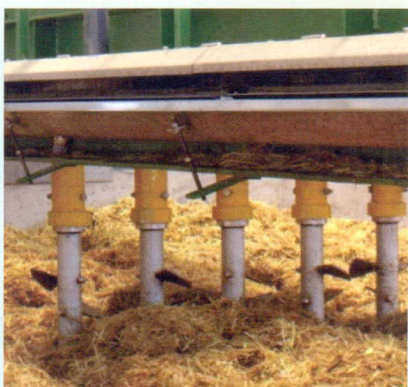
Un particolare delle coclee durante la movimentazione della biomassa

“in magazzino” e, assolvendo nel contempo funzioni fisiche, biologiche e chimiche, si rivela il fattore determinante per la fertilità di un terreno. Per consentire il reintegro della quota annua di humus che si perde per effetto delle lavorazioni del terreno, è necessario aumentare la resa in humus della matrice organica e ciò è ottenibile soltanto se i diversi materiali sono sottoposti ad un trattamento di compostaggio. Attraverso il biocompostaggio è possibile anche aumentare il contenuto netto di sostanza organica dei terreni, realizzando un vero e proprio sequestro di carbonio nei suoli. Esattamente quello che ci viene chiesto di fare in base agli impegni che il nostro paese ha assunto con la sottoscrizione del Protocollo di Kyoto.